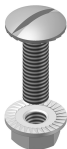
Zelfborgende moer en bout VM