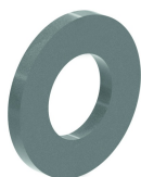
Rondelle (DIN 125-1 A) RO