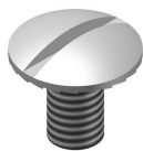
Boulon à tete ronde autobloquant RB