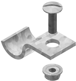
Etrier de fixation pour HDKLIE HDBKID25

Matériel de fixation: 1 par mètre. SLOS60 non adapté au couvercle HDDI.