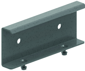
Eclisse pour HDKLIE HDLVIE