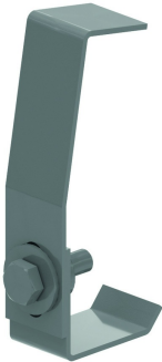
Attache couvercle pour HDKLIE DKI

Pour des largeurs > 400 mm, le couvercle est pourvu de nervures de renforcement.