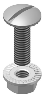
Boulon et écrou autobloquant VM