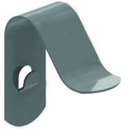
Deckelklemme klipsbar DCL